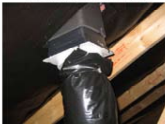
Mangelfuld samling mellem aftrækskanal og undertag