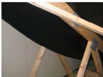
Manglende afskæring af undertagsbane (flap)