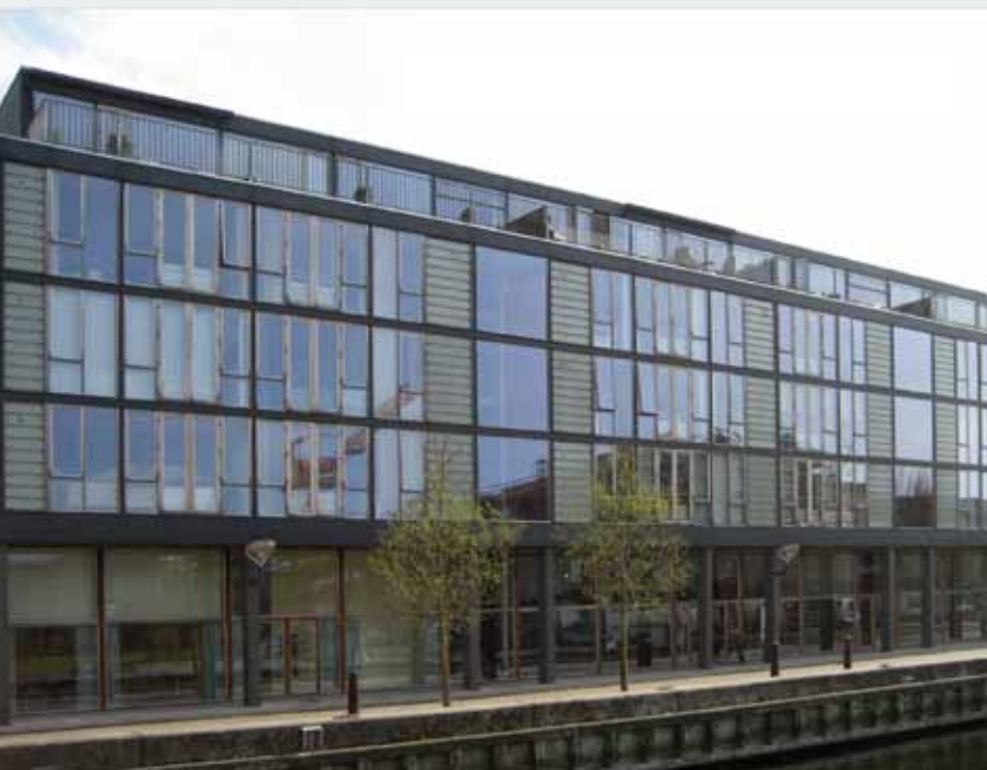
Byggeri med vinduer og døre udført i jatobatræ – og med udsat beliggenhed.

Byggeskadefonden vurderer, at der i denne sag er sket en række fejl på forskellige niveauer i forbindelse med disponering, projektering, udbud, produktion og rådgivning om drift, som tilsammen har medført, at levetiden på vindueselementerne er opbrugt efter kun 10 år, og i den tid har det været nødvendigt at foretage omfattende forbedringer for at forhindre følgeskader. Glaslister er blevet udskiftet fra træ til alu-lister, og lukkebeslagene er blevet udskiftet/suppleret.